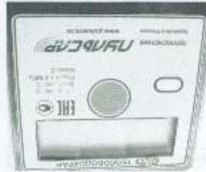
а) вид сверху

Маркировка вычислителей теплосчетчиков модификаций "Пульсар" Т, "Пульсар" У и "Пульсар" УТ приведена на рисунке 4.