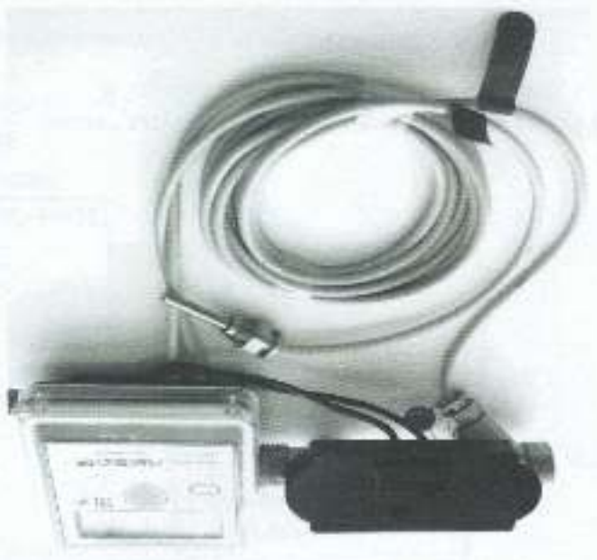
в) модифицированный "Лузсар" V