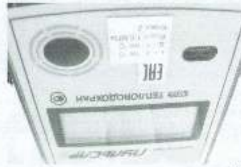
а) вид сверху

Маркировка вычислителей теплосчетчиков модификаций "Пульсар" К приведена на рисунке 3.