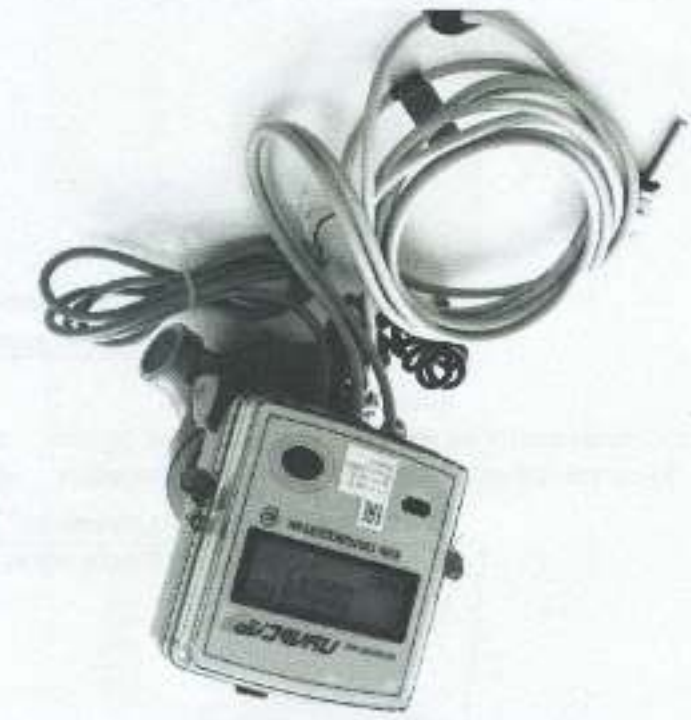
а) модифицированный "Лузсар" К