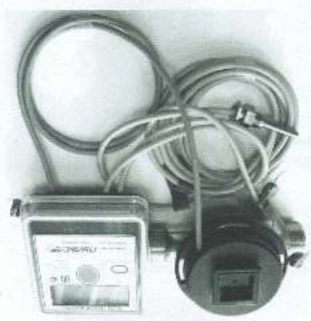
с) модифицированный "Лузсар" T